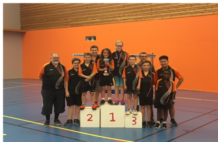
nos jeunes ont remporté le trophée Roger Brossard lors de la finale des Match'Ping en 2018