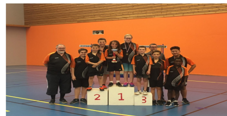
nos jeunes ont remporté le trophée Roger Brossard lors de la finale des Match'Ping en 2018